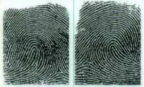
Ngón trỏ trái Left index finger